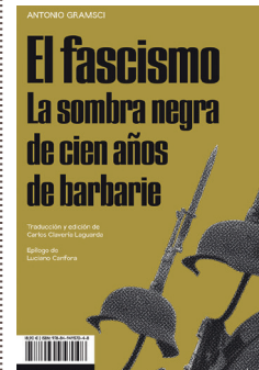
Autor: Antonio Gramsci Editorial: Altamarea 18,90€ / 224 pp.

G ramsci, uno de los pensadores políticos más importantes de período de entreguerras, firma este ensayo sobre el fascismo italiano en el que se recogen diferentes artículos y escritos que el pensador marxista italiano publicó en diferentes periódicos a finales de la década de 1910 y principios de la de 1920 sobre diferentes aspectos políticos de la Europa de su tiempo. En ellos, la llegada del fascismo al poder y su influencia en el resto del continente queda patente. La lúcida mirada de Gramsci nos ofrece un testimonio fundamental sobre la formación y el ascenso de las camisas negras de Mussolini desde la óptica de uno de sus enemigos.