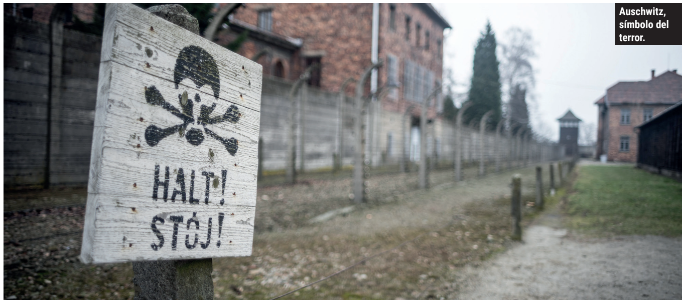
Auschwitz, símbolo del terror.