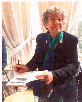
La escritora Dacia Mariani.

Qué duda cabe que haber pasado dos años de penurias, de los siete a los nueve, en un campo de concentración japonés ha cincelado el carácter combativo y dramático de esta escritora italiana de referencia, compañera de Moravia y amiga de los grandes narradores de los 60: Pasolini, Calvino, Fellini... El neorealismo está pues prendido en su piel literaria tanto como ese niño fantasma al que no logra dar a luz y que pasea por este libro convirtiéndose en el hilo conductor de una interesante reflexión sobre la maternidad.