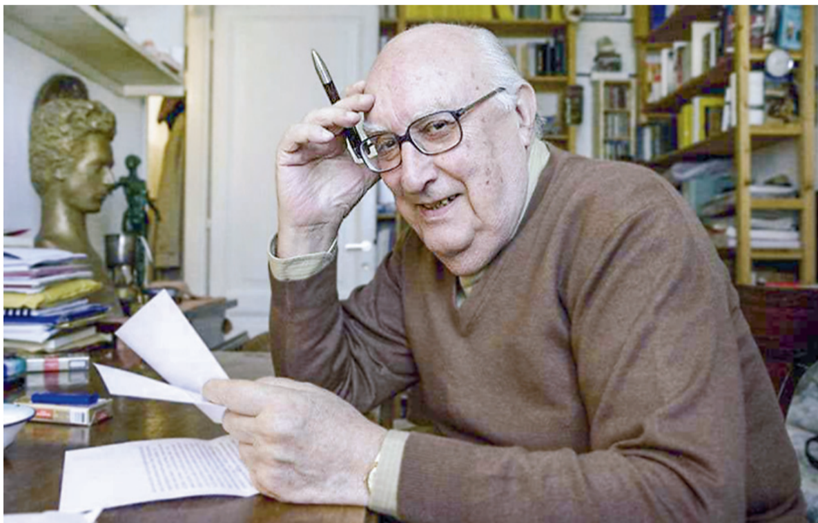
Andrea Camilleri nos traslada a Vigàta, lugar que sirve de salvoconducto para la crítica social

Sin embargo, el genio de Camilleri no se agota con las pesquisas de Montalbano. Por su obra también pulula una galería de personajes tan histriónicos como entrañables que, sin pedir nunca permiso, traspasan la frontera de la hipérbola. Hablamos de los demás vecinos de Vigàta, incrustados en la Sicilia